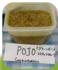
ケニアのグリーンビーンズ ココナッツカレー (2019)