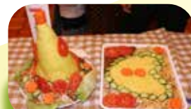
インドネシアのお祝いご飯 「ナントゥンペン」 (2010)