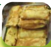
ロシアのクレープ (2012)