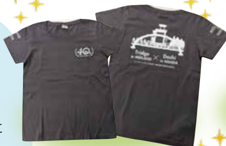
▲半田市が作成したTシャツ