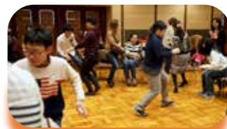
フルーツバスケット