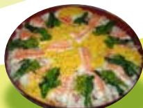
日本のチラン寿司 (2007)