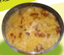
ブータン料理「ケワダツィ」 (2005)