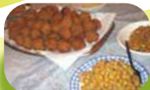
スリランカのスパイシーカレーコロッケと ひよこ豆 (2006)