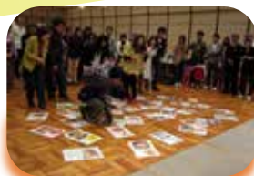
ジャンボカルタ取り