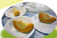
カンボジアのかぼちゃプリン (2013)