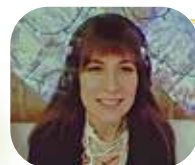
▲ミオさんは交換生として半田に来たことがあります