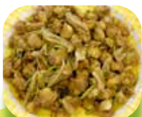
カンボジアの 「チャークダウ」 (2018)