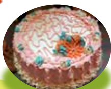
ボリビアの手作りケーキ (2016)