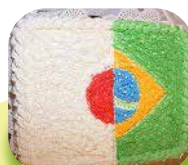
ブラジルと日本の 国旗のケーキ (2011)