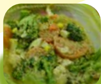
インドネシアの「ガドガド」 (2014)