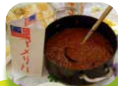
アメリカ料理「チリビーンズ」 (2009)