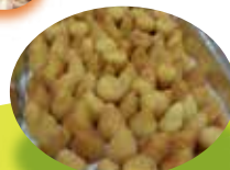
ブラジルのコロッケ「コシーニャ」 (2008)