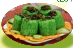
ベトナムのお祝い餅 (2017)