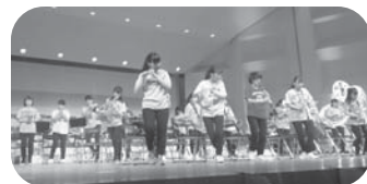
半田商業高校吹奏楽部

半田ジュニアプラスバンドとのコンサートが、今年も実現しました。『パイレーツ オブ カリビアン』や『スターウォーズメロデー』など、おなじみの映画音楽