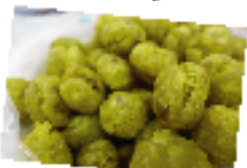
▲台湾スイーツ お芋の 揚げ餅“地瓜球”