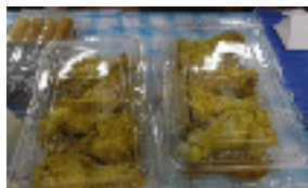
▲カンボジアの蒸し鶏 “チュン マアン チョムホイ”

タレの材料は、ココナツミルク、落花生、ピーナツバター、赤唐辛子、フライドオニオン、ニンニク、砂糖、醤油。インドネシア料理に欠かせない赤ラッキョウを探したけど見つかることができなかったとのこと。