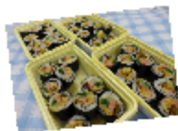
▲韓国ののり巻“キンパツ”と春雨“チャブチェ”