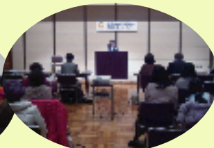
審査は2会場で行われました 自分の好きな作品の一部を2-3分で朗読します