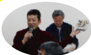
松石会長よりお料理の紹介