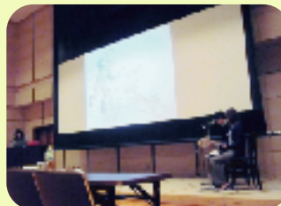
審査結果を待つ間、 知多半島SGGクラブ による「手袋を買いに」 の英語朗読