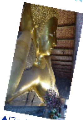
▲ワットポーの巨大な涅槃仏