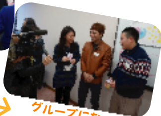
グループになった 外国の方を紹介