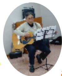
みんなで日本の歌をたくさん歌いました♪