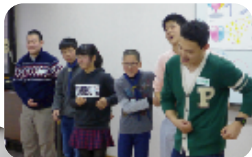
ボーイスカウトの皆さんによる アクションリングゲーム★