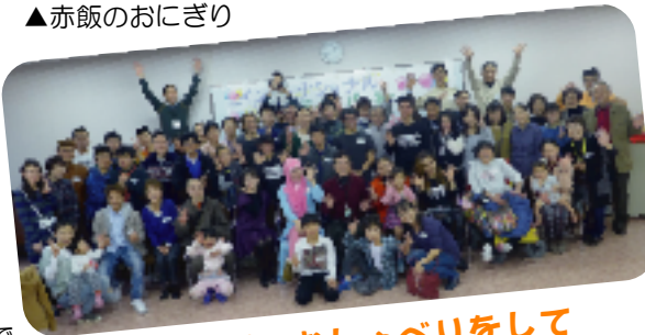
いっぱいおしゃべりをして いっぱい食べました！