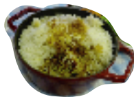
▲インドの炊き込みご飯 “チキンピリヤニ”