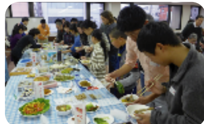
どれもおいしそう〜♪