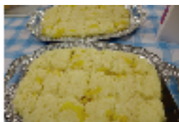
▲フィリピンのココナツミルクで 炊いた餅米スイーツ