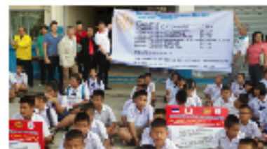
▲17校の代表の生徒たち