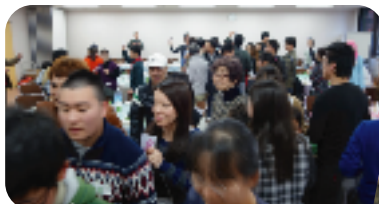
グループ探しゲーム★ 同じイラストのカードの人を 探します