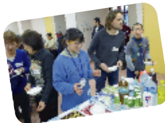
あなたのお料理はどれ？