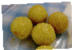
▲中国のゴマ団子“芝麻球”