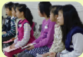
緊張して順番を待つ子どもたち