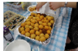
▲ブラジルのコロック “コシーニャ”