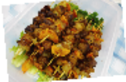
▲ベトナムの焼き肉と春巻き