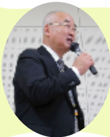
市長から激励の言葉をいただきました

「『手袋を買いに』では、まるで本当に雪が降っているかのような語りかけでした。こちらまで冬の寒さが伝わってきました。」