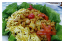
▲インドネシアの発酵大豆 “テンペ”を使ったお料理