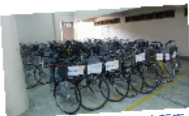
▲寄贈した300台の自転車