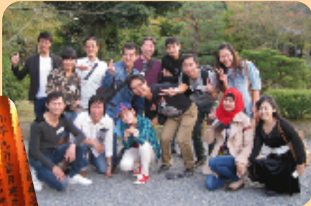
▲平等院にて、仲間と一緒に

イギリス、ペルー、ブラジル、アメリカ、ベトナム、インドネシア、タイ、フィリピン、中国の9カ国の生徒たち75名と、引率のボランティアさんを含め合計96名が参加し、金閣寺、伏見稲荷、平等院を見学、日本の歴史や文化を学びました。