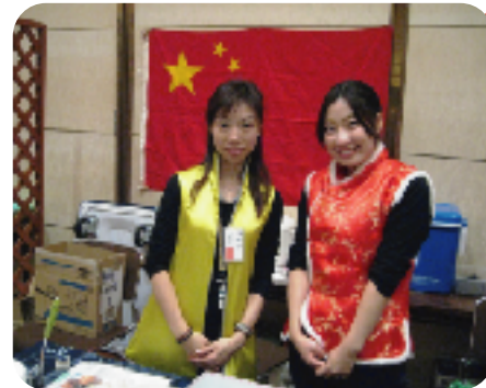
茶卵、翡翠餃子、桃あんまん、中国点心いろいろ！