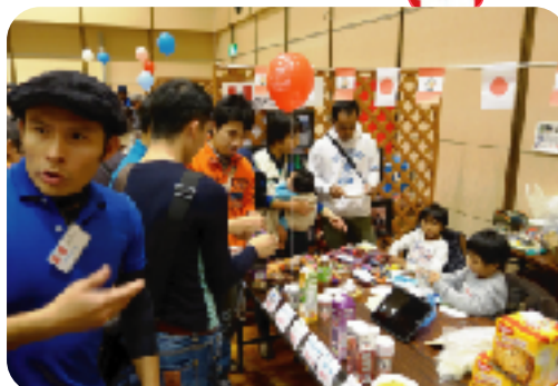
ペルーのチチャモラーダ(紫とうもろこしのジュース) 飲んでみて！