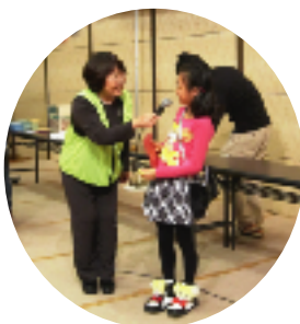
1等の旅行券あたりました！