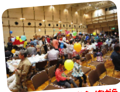
各国のおいしいものを食べながら