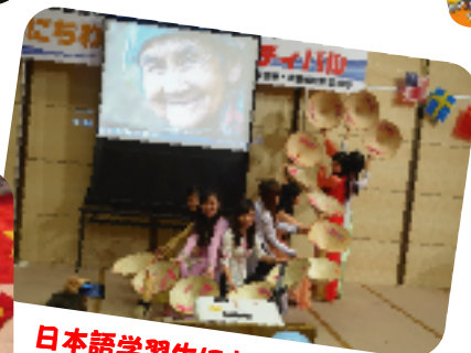
日本語学習生によるベトナム紹介