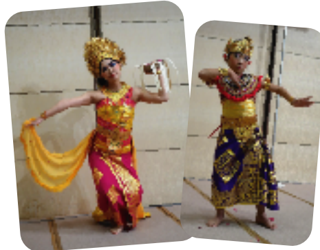
衣装も美しいバリダンス