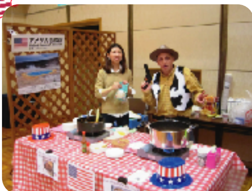
アメリカンチリ、大好評！