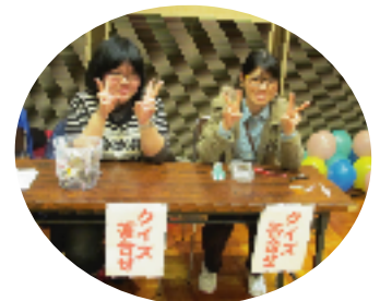
世界のクイズ、挑戦してね★