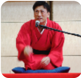
喜餅さんの英語落語“動物園”に みんな大笑い(´O´)