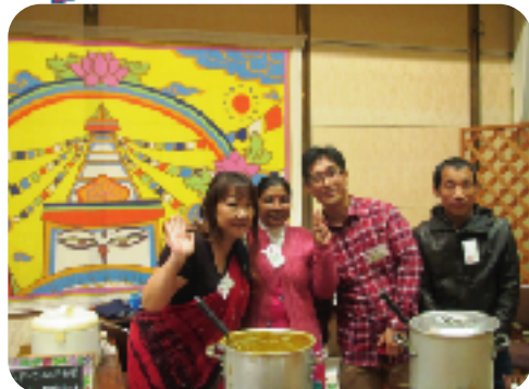
ネパールのチキンカレーと野菜カレー、 おいしいよ♪