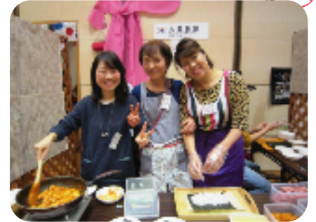
韓国ののり巻はいかが？