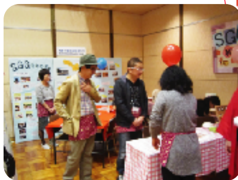
お抹茶と和菓子はいかが？(知多半島SGGクラブ)