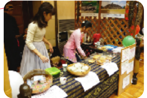
インドネシアのちまきもあるよ～