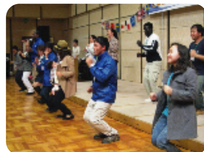
チキンダンス、観客もオイスカの皆さんと 一緒に楽しみました！