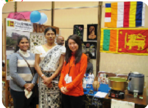
スリランカの衣装でおもてなし