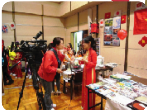
ベトナムブース、ケーブルテレビの インタビューを受けました！