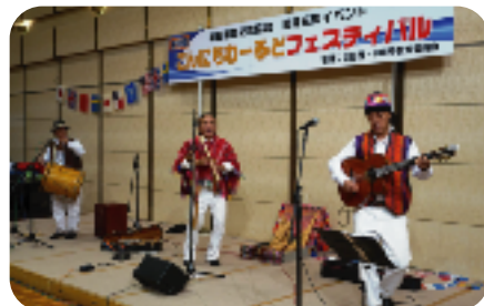
EKEKOSの皆さんによるラテンフォルクローレ。 ♪ケーナの音にのせて♪