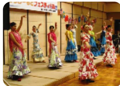
カステネットに合わせて“オーレ！”