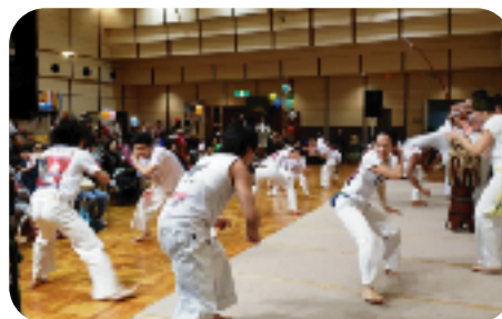
今年11月にユネスコの人類無形文化遺産に 登録されたブラジルの格闘技、カポエイラ