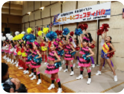
今年5月の世界大会で優勝に輝いた TEAM-HIMAWARI