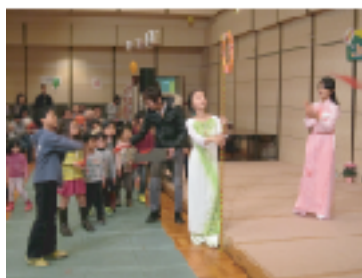
ベトナムの玉入れゲーム なかなか難しいよ～