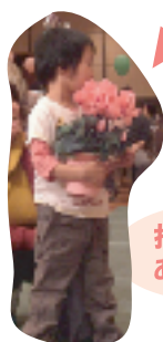
抽選会で あたったよ！