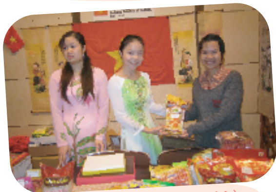
ドリアンケーキはいかが？(ベトナム)