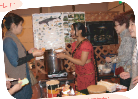
“あ〜ゆ〜ほ〜わん”(こんにちは) (スリランカ)