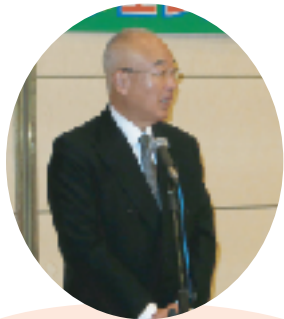
「いろんな国の味が楽しみです」 (市長)