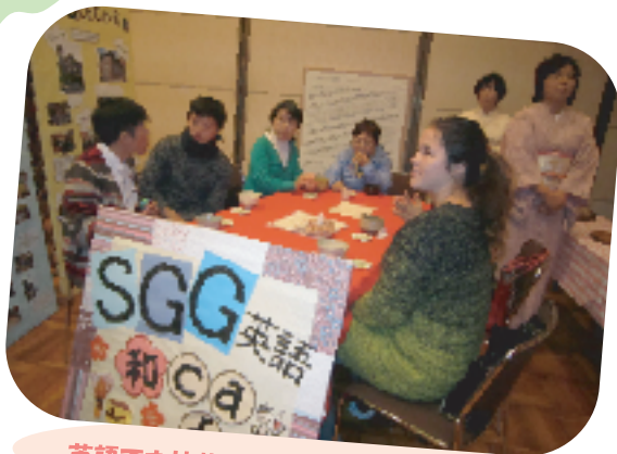
英語でお抹茶体験(知多半島SGGクラブ)