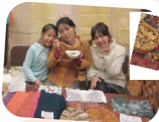
かわいい雑貨が並ぶネパールブース