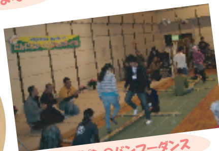
フィリピンのバンブーダンス