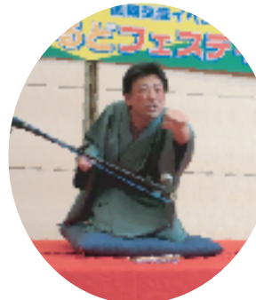
英語で落語 みんな分かったかな？