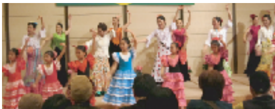
みんなでフラメンコ「オーレ！」