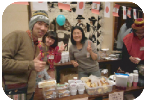
珍しい紫トウモロコシのデザート（ペルー）