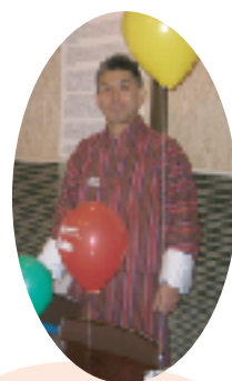
ブータンの民族衣装 “ゴ”