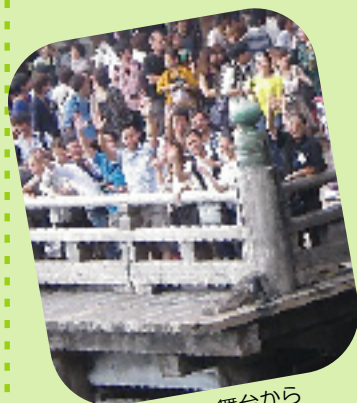
▲清水の舞台から 「こたよ〜」