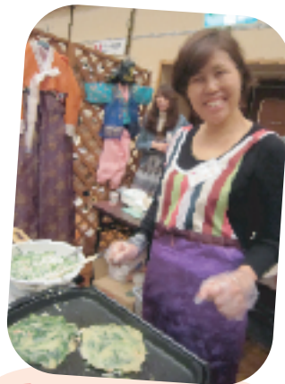
チジミおいしいよ！(韓国)