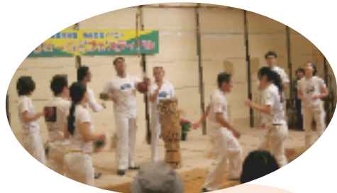
ブラジルの格闘技にハラハラ