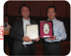
▲協会からのお土産は能面