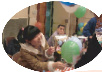
“世界の言葉であいさつを”(日本語学習生)