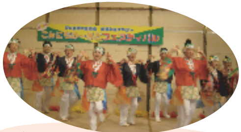
一緒に踊ろう！(はんだ踊りん！チーム“GON”)