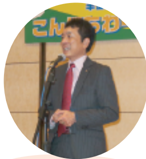
「皆さん、楽しんでください」 (会長)