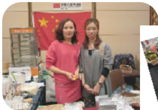
中国茶の香りにさそわれて