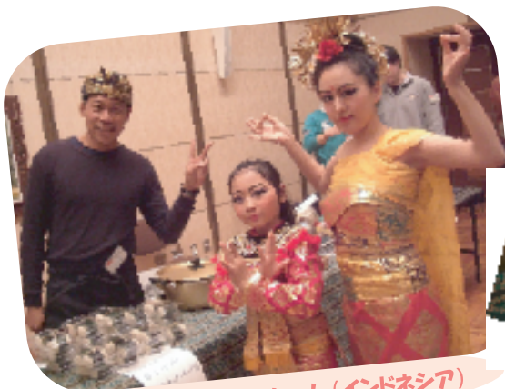
民族衣装ステキでしょ！（インドネシア）