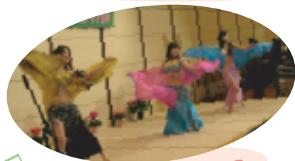
注目のペルーダンス