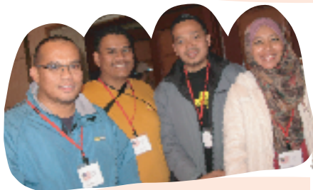
私たちはオイスカ(国際協力NGO)の研修生です