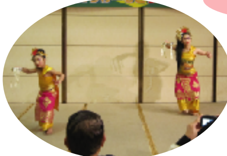
芸術的衣裳がめずらしい バリダンス