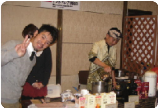
バリコーヒーとジュースとりどり (インドネシア)