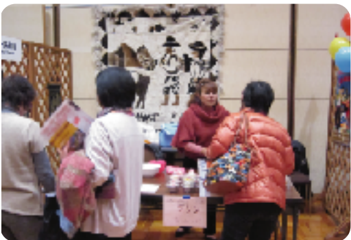
ペルーのタペストリーを飾って