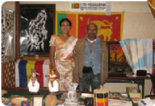
スリランカカレー

2012年12月1日(土)雁宿ホールの講堂で、“世界カフェめぐりの旅”をテーマに、第10回こんにちわーるどフェスティバルが行われました。インドネシア、ベトナム、スリランカ、ネパール、アメリカ、ペルー、中国、日本の8か国のカフェブースが、その国の軽食や飲み物を販売しました。その他、ブータン紹介、トルコやネパールなどの雑貨販売、旅行代理店などの、世界を身近に感じるブースが並びました。来場者は、スタッフも合わせて約400人。午後には品切れのお店も続出し、盛況のうちに終わりました。