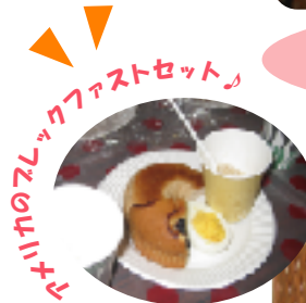
アメリカのスレックファストセット