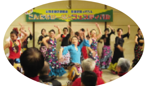
エネルギッシュなフラメンコ [TAKAGIフラメンコ]