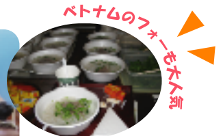
ベトナムのフォーも大人気