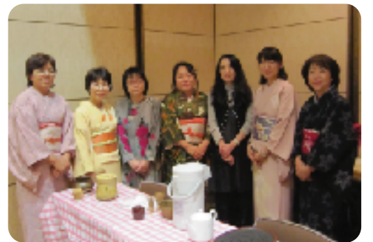
和服姿で、お抹茶はいかが？ [知多半島SGGクラブ]

2012年11月7日、中米グアテマラ沖でM7.4という大きな地震が発生しました。2005年の愛・地球博において、ブータン王国と同じく半田市のフレンドシップ相手国であったグアテマラ共和国に対し、半田国際交流協会では、少しでも支援したいと、義援金箱を設置しました。募金と合わせて、こんにちわーどフェスティバルの、カフェ・雑貨ブースの売り上げの一部(20,080円)を寄付いたします。尚、送金には、徳倉建設株式会社様のご協力をいただきました。