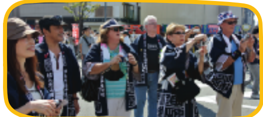
▲山車まつりの法被を着て