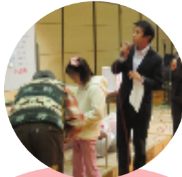
お楽しみ抽選会 当たったよ！