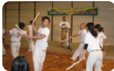
ヒヤヒヤ・ドキドキ・カポエイラ [セントロ フラジレイロ カポエイラ]