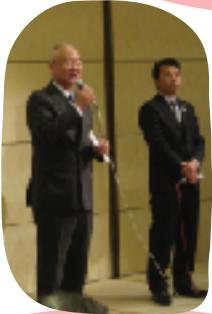
市長と議長も来て くださいました！