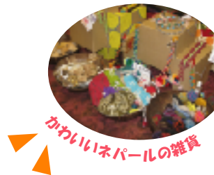
かわいいネパールの雑貨