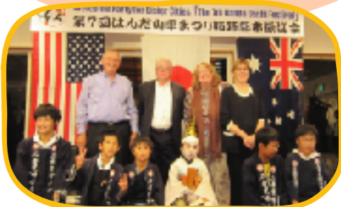
▲歓迎会にて 住吉区北組三番叟と