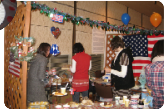
ホットチョコレート、おいしかった！ (アメリカ)