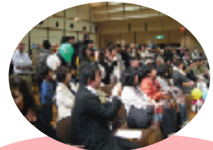
ベリーダンスにくぎづけ