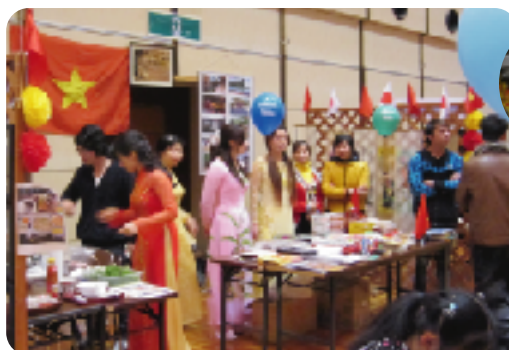
カラフルなアオザイのベトナムレディたち