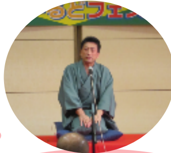
古典落語を英語で [知多半島SGGクラブ]