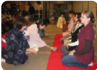
英語解説でお茶席体験 [知多半島SGGクラブ]