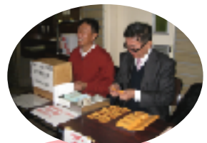
千ヶツト よく売れました