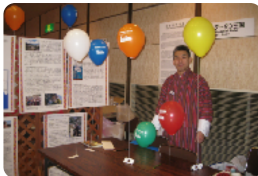
ブータンの民族衣装「ゴ」で