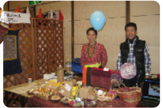
甘いお菓子和辛いお菓子をどうぞ！ (ネパール)