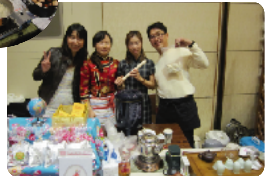
中国茶と点心いろいろ