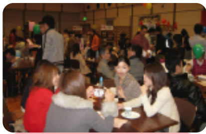
大繁盛のレストランのよう！