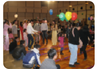
みんなでベトナムの バンブーダンス