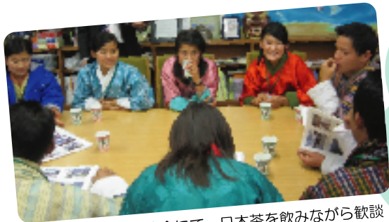
▲半田国際交流協会にて 日本茶を飲みながら歓談

その後一行は、名古屋市に滞在した後、岩手県陸前高田市や宮城県気仙沼市を視察しました。