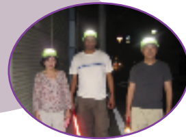
▲住吉区防犯パトロール(9/15)