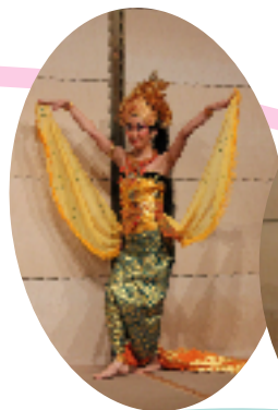
ミツバチと老人の踊り (インドネシア)