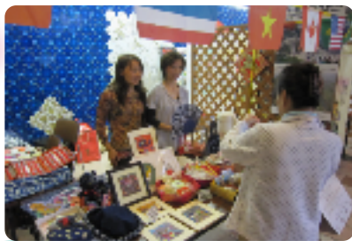
手作りのかわいい小物がいっぱい (中国)