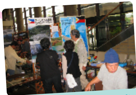
約7000の島からなるフィリピン