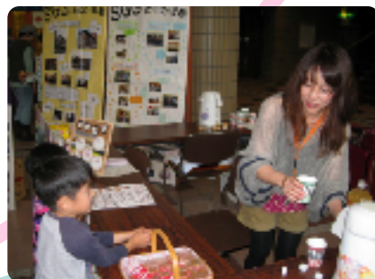
お茶とお菓子をどうぞ!【知多半島SGGクラブ】

いろんな国のブースや舞台でのパフォーマンスを見たりすると、それぞれの文化の違いが感じられ、興味深いものでした。 最後は、全員で“ジェンカ”の曲にあわせて踊り、笑顔あふれるなか幕をとじました。 外国人を含むたくさんのボランティアの皆さまがこの一日を盛り上げてくれました。