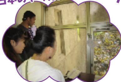
▲クリーンセンター見学(10/7)