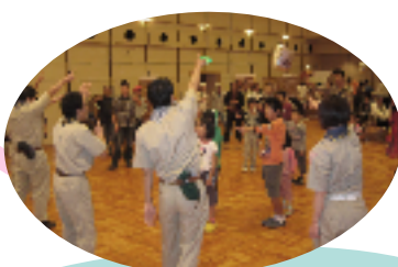
ボーイスカウトのお兄さんたちと みんなでゲーム