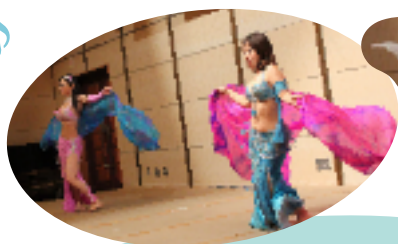
魅惑的なベリーダンス【フェステ】