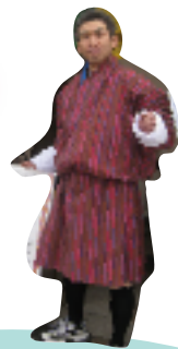
ブータンの民族衣装「ゴ」