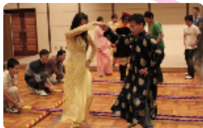
リズミカルなバンフーダンス、 次々と飛び入りで参加 (ベトナム)