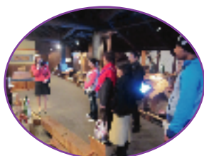
▲半田の文化、歴史を学ぶ(11/18)