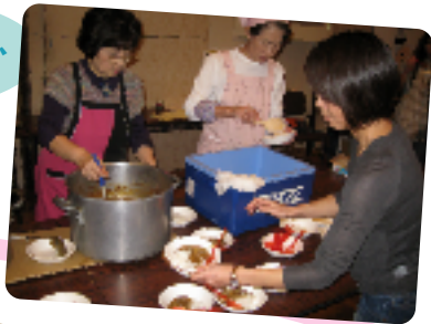
スリランカ・カレー、 ごちそうさま