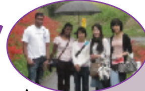
▲彼岸花を見学後、岩滑区長訪問(9/26)