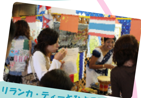
スリランカ・ティーとひよこ豆、 おいしかった!