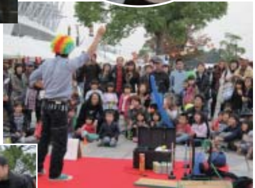
▲日本福祉大学学生による大道芸