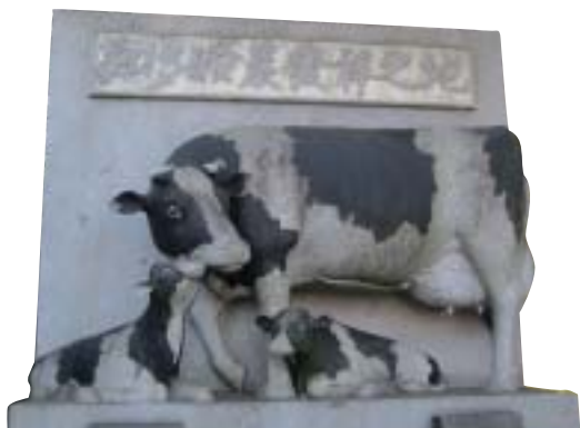
▲ 半田駅前のレリーフ