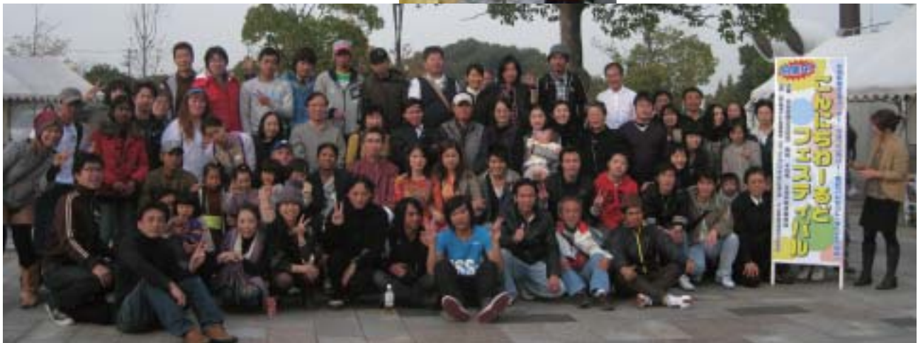
▲私達ボランティアスタッフは、いろいろな活動をしています。仲間に入りませんか?