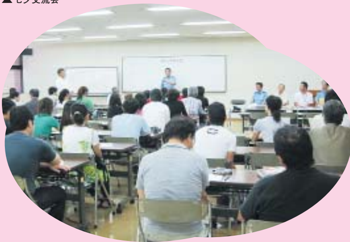
▲おまわりさんによる 交通ルールなどのお話