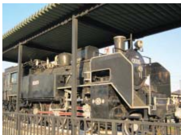
▲ 半田駅前に展示されている最初のキカン車

現存する亀崎駅は日本一古い駅舎であり、半田駅の跨線橋は、JRでは最も古いものです。