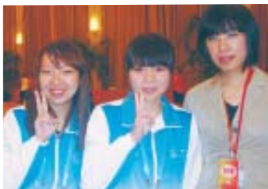
▲中国人青少年ボランティアの2人と一緒に

今回の訪問で、お互いの理解を深めるには、直接交流することが一番だと改めて感じました。日本に関心を持っている人もたくさんいることを知れば、またその国の印象も変わります。万博の日本館には4時間待ちの長い列がありました。(N.I)